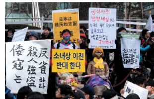
激化する韓国の反日デモ

その上、中国や北朝鮮、韓国による反日宣伝によって、世界の人々が憧れる日本の美点に日本人自身が気づかず、愛国心について語ること自体が、憚られる風潮にあるのが現実です。