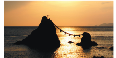
伊勢二見浦・夫婦岩の夜明け

季刊ムック『和ORLD（ワールド）』は、毎号一家に1冊「完全保存版」を目標に、できるだけ図版や写真を多用して「読みやすく、分かりやすく」をモットーに、編集しております。