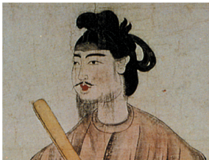
日本の国柄を示した聖徳太子

ご存知のように万世一系126代、2,680年間続いている日本の皇室は、現存する世界の王室の中で最も長い歴史を誇り、併せて日本が世界最古にして最長記録を更新している、まさに奇跡的な国家であることを改めて世界に知らせました。