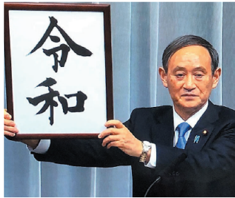
新元号「令和」の発表

今上陛下の御即位と共に、これまでの中国古典を典拠とした元号から初めて日本の古典『万葉集』を典拠とした元号「令和」が定められ、新たな時代が始まりました。