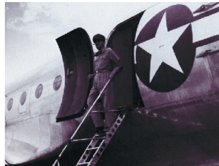
GHQの占領政策が元凶

今日の日本は、戦後のGHQ（連合国軍総司令部）による日本無力化政策WGIP（ウォー・ギルト・インフォメーション・プログラム）に感化された、日教組やマスコミなどによる自虐史観の影響で、愛国心や伝統などが根底から破壊されてしまいました。さらに、日本の革命を狙う共産主義者らによる工作は、各界各層に及んでおり、残念ながらどこの国民でも持っている国を愛する心や道徳心などが失われた状態になっています。